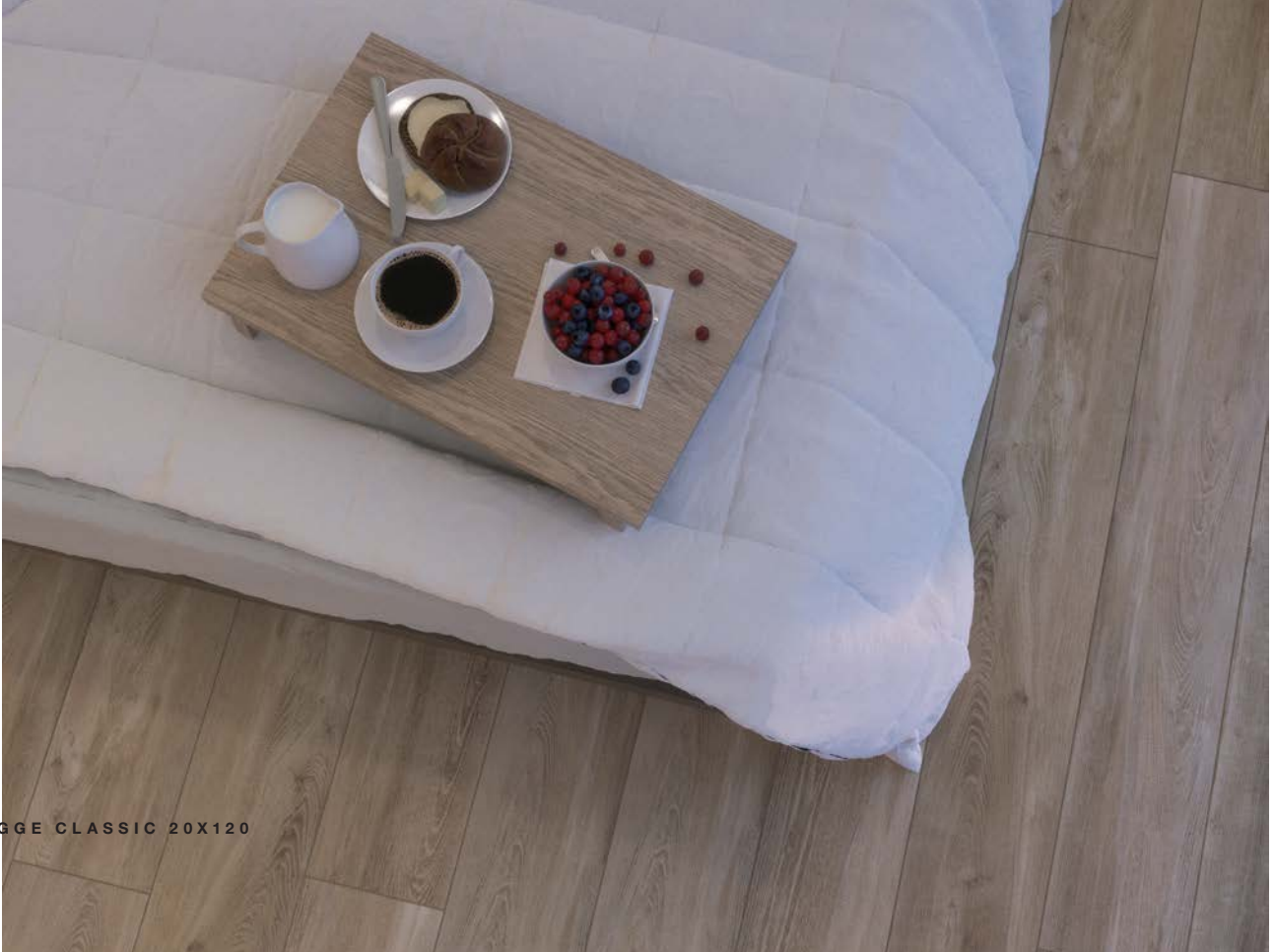
HYGGE CLASSIC 20X120

Suite au grand succès de la collection Lodge, une gamme spin-off voit le jour avec Lodge Natural et deux coloris de parquets naturels supplémentaires baptisés « Hygge ». Cuisiner de bons petits plats en famille ou entre amis, et profiter ensemble de la douce chaleur d'un feu ouvert, c'est cela le « Hygge ». Mais c'est aussi faire la grasse matinée. Avec ce look parquet, vous pourrez créer partout dans votre maison une ambiance cosy et chaleureuse.